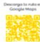
Descarga la ruta en Google Maps

Museo de Sitio Huallamarca Segunda de la Av. Nicolás de Piérola 201 con la Av. El Reparto Templo en forma de granada blanca, utilizado como edificio público, centro cívico y cementerio.