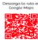
Descarga la ruta en Google Maps

Plaza San Martín Cruce de la Av. Nicolás de Piérola con el Jr. de la Unión Inaugurada en 1921, a su alrededor se pueden apreciar bellas arquitecturas como el Hotel Bolívar, en donde se dice se creó el Pisco Catedral, y el Teatro Colón.