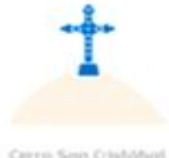
Cerro San Cristóbal

Antiguas iglesias, museos ricos en expresiones artísticas y culturales, plagas, parques frente al mar y la más rica gastronomía. Estos son solo algunos de los lugares que harán de tu visita a Lima, una experiencia inolvidable.